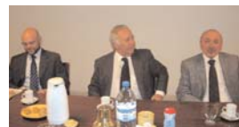
Firma del protocollo d'intesa

Bianchi e Michel Torino ci danno l'idea della provenienza dei rizomi. Alla degustazione risultano più freschi e piacevoli i vini bianchi mentre i rossi, anche se provenienti da ceppi piemontesi, risultano molto più tannici e meno equilibrati dei cugini italiani. L'Università di Agraria ed Enologia "Don Bosco" è tra le più importanti della provincia di Mendoza. Colpisce l'immagine del Santo in etichetta assieme alle scritte Tocay, Torrontés e "Envasado en Origen" (la nostra D.O.C.). Alla scuola Salesiana i nostri allievi hanno frequentato corsi di enologia e per sommelier. Mi è tornato alla mente quanto avevo letto dai "Sogni di Don Bosco", pubblicato a San Benigno Canavese nel 1883: "E il treno andava sempre in giù, e gira da una parte e gira da un'altra, dopo un lungo spazio di tempo, si fermò la seconda volta. Quivi molta altra gente scese dal convoglio e passava essa pure sotto le Cordigliere andando verso occidente. Don Bosco indicò nella Repubblica Argentina la provincia di Mendoza. Quindi la stazione era forse Mendoza, e quella galleria metteva a Santiago, capitale della Repubblica del Cile. Il treno riprese la sua corsa attraverso le Pampas e la Patagonia. I campi coltivati e le case sparse qua e là indicavano