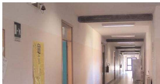
Rispetta attrezzature e ambienti della tua giornata scolastica

Registrazione Tribunale di Pinerolo n. 5 del 22 novembre 2002 Stampato in 1000 copie presso la Tipolitografia Giuseppini