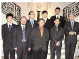
Il gruppo con l'ambasciatore

vissuto dal 1841 al 1848 in una modesta abitazione di Montevideo, capitale dell'Uruguay, che si trova di fronte a Buenos Aires. Numerose sono state le manifestazioni per il bicentenario della nascita di Garibaldi (l'eroe "dei due mondi" è nato il 4 luglio 1807 a Nizza, città che apparteneva allora all'Italia). Dopo il primo mese trascorso a Buenos Aires gli allievi si sono recati a Mendoza, città che si trova più a nord, a pochi chilometri dalla cordigliera delle Ande. Grande è stata la sorpresa quando abbiamo visto che il paesaggio era simile a quello delle Langhe, con lussureggianti par-