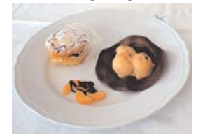
Il dolce scelto dalla giuria