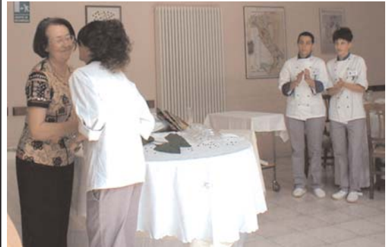
Il momento della premiazione

Il 23 maggio si è svolta nei locali del nostro Istituto la quarta edizione del concorso "Pasticceria Internazionale" - Chiriotti Editori rivolto agli allievi delle classi III di Cucina, selezionati dall'insegnante della classe. I partecipanti dovevano realizzare un dessert al piatto composto da un prodotto da forno con frutta e cioccolato, servito tiepido e accompagnato da un sorbetto di frutta (pere o albicocche), appoggiato su una base (cialda o altro). Il tutto doveva essere rifinito con salsa o coulis e decorato. Ogni candidato doveva redigere e consegnare la scheda tecnica della ricetta che doveva essere realizzata in sei porzioni, di cui una da presentazione e le restanti da assaggio alla giuria. La durata della prova era fissata in tre ore ed era consentito solo l'uso di basi già pronte (pan di Spagna, pasta frolla, pasta sfoglia), mentre tutto il resto doveva essere realizzato al momento. I criteri di valutazione tenevano conto dell'organizzazione del lavoro in laboratorio, della presenza e stile del candidato, della presentazione del piatto, della qualità aromatica, del gusto e della cottura e per ognuna di queste voci venivano assegnati da 1 a 20