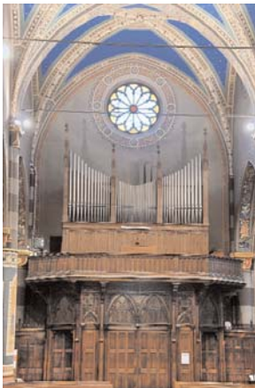
L'organo del duomo di Pinerolo

Durante il Medioevo, l'organo trovò posto in tutti gli edifici di culto di una certa importanza; per proteggerlo dalla polvere ed integrarlo nell'apparato iconografico del tempio in cui era collocato, venne progressivamente dotato di portelle in legno finemente decorate (talvolta affidate alla mano di veri geni della pittura: pensiamo alle portelle del Parmigianino, ancor oggi visibili sull'organo di destra della chiesa della Steccata di Parma). Posizionato in cantorie sopraelevate costruite a fianco del presbiterio, alla destra o alla sinistra dell'altare maggiore, l'organo aveva modo di accompagnare il canto dei sacerdoti o dei monaci seduti in scranni che si trovavano davanti all'al-