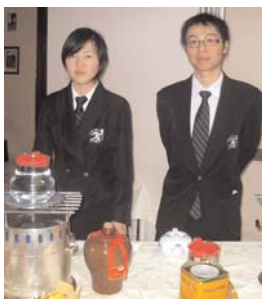
Gli allievi al servizio del tè

Nell'ambito del progetto "Il Milione", il 16 febbraio, XV giorno del primo mese lunare, si è svolta la tradizionale festa cinese delle Lanterne che ha origini millenarie. Il menu, realizzato dalla classe III D Cucina coordinata dal