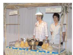
Un tavolo per le bevande