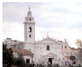
Nuestra Señora del Pilar

Bianchi e Michel Torino ci danno l'idea della provenienza dei rizomi. Alla degustazione risultano più freschi e piacevoli i vini bianchi mentre i rossi, anche se provenienti da ceppi piemontesi, risultano molto più tannici e meno equilibrati dei cugini italiani. L'Università di Agraria ed Enologia "Don Bosco" è tra le più importanti della provincia di Mendoza. Colpisce l'immagine del Santo in etichetta assieme alle scritte Tocay, Torrontés e "Envasado en Origen" (la nostra D.O.C.). Alla scuola Salesiana i nostri allievi hanno frequentato corsi di enologia e per sommelier. Mi è tornato alla mente quanto avevo letto dai "Sogni di Don Bosco", pubblicato a San Benigno Canavese nel 1883: "E il treno andava sempre in giù, e gira da una parte e gira da un'altra, dopo un lungo spazio di tempo, si fermò la seconda volta. Quivi molta altra gente scese dal convoglio e passava essa pure sotto le Cordigliere andando verso occidente. Don Bosco indicò nella Repubblica Argentina la provincia di Mendoza. Quindi la stazione era forse Mendoza, e quella galleria metteva a Santiago, capitale della Repubblica del Cile. Il treno riprese la sua corsa attraverso le Pampas e la Patagonia. I campi coltivati e le case sparse qua e là indicavano