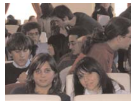
Una fase dei lavori

gnava portare un manifesto di presentazione del proprio Istituto e copie dei giornalini realizzati per confrontarli con quelli delle altre scuole. Oltre alle autorità che hanno dato inizio ai lavori, sono intervenuti i docenti universitari Mario Furlan e Pierpaolo Triani. Ogni scuola aveva a disposizione un suo spazio espositivo per illustrare ai visitatori le varie iniziative e distribuire copie dei giornalini.