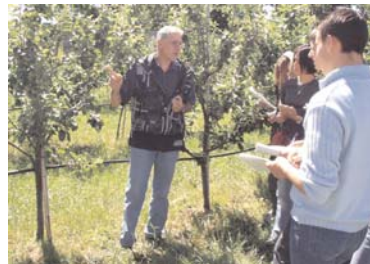
Lezioni "sul campo"

Immagini e testi sono tratti dal sito dell'Istituto e si possono consultare all'indirizzo http://www.cultura.pinerolo.it/agroambientale.htm