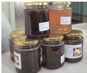
Vasetti di miele