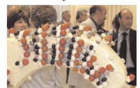
Composizione per antipasti