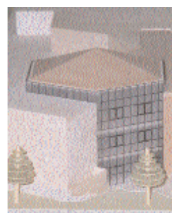
Il plastico del nuovo edificio