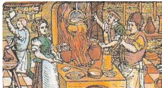
Raffigurazione di una cucina medievale

P.S. Non dica alla mia classe che passo a trovarvi.