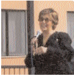
Il Presidente della Provincia di Torino Mercedes Bresso