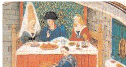
Tavola apparecchiata per il pranzo