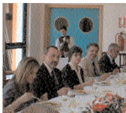
Un pranzo a scuola

Caro lettore, dopo un decennio "Il Fumo" passa il testimone a questo nuovo giornalino. Su richiesta dei ragazzi, che sentivano il bisogno di un loro strumento di comunicazione, era nato "Il Fumo", nome scelto dagli stessi allievi. La redazione, improvvisata di anno in anno, non sempre è riuscita a mettere in pratica quanto aveva in mente. Nonostante tutto, pur con qualche ritardo e con scelte criticabili (si tratta, non bisogna dimenticarlo, di un prodotto amatoriale), il giornalino era rimasto in vita. A decretarne la fine non sono stati né la mancanza di motivazioni, né l'affievolirsi dell'entusiasmo iniziale, ma gli elevati costi di pubblicazione. Sono però rimaste intatte le esigenze di comunicazione ed è per questo che dalle ceneri di "Il Fumo" è nato "Il Convito".