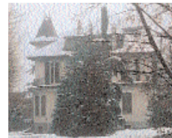
La sede di Villa Prever

potenza, unita ad altre due doti spesso difficili da congiungere alla prima (soprattutto nelle strutture pubbliche): efficienza e rapidità. Dopo aver sentito le esigenze dei destinatari, nel novembre 2001 già si addiuvano al progetto preliminare di ampliamento realizzato dall'architetto Maria Paola Burdino, tecnico della Provincia originaria di Pinerolo. L'impianto architettonico ripresenta nuovo rispetto all'idea iniziale e nei primi mesi del 2002 viene ancora rivisitato in fase esecutiva. Il 20 settembre 2002 il progetto risulta già appaltato e presto l'Impresa Immobiliare Sabena di Settimo Torinese aprirà il cantiere. Il nostro Istituto, completamente rinnovato nelle sue strutture, sta ora approfondendo al proprio interno il suo cammino didattico e rinnovando la sua offerta formativa. In questa scuola, nel corrente anno scolastico,