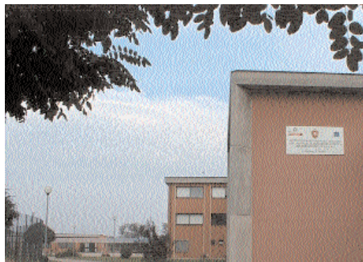
Una veduta complessiva della nuova sede