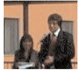
L'Assessore provinciale al sistema educativo e formativo Gianni Oliva