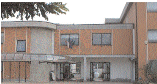
L'ingresso per accedere alle aule e agli uffici