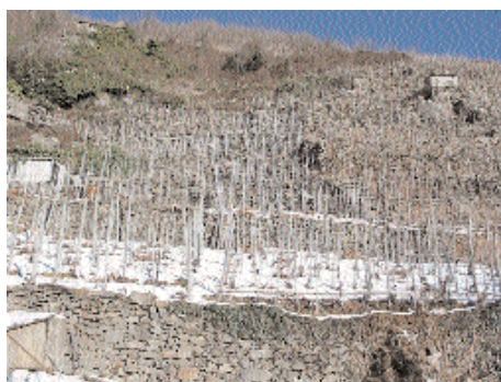
Piccoli terrazzamenti di vitigni a Pomaretto, ricavati dopo i disboscamenti con muretti a secco riempiti con dei rami (da cui deriverebbe il nome Ramié)